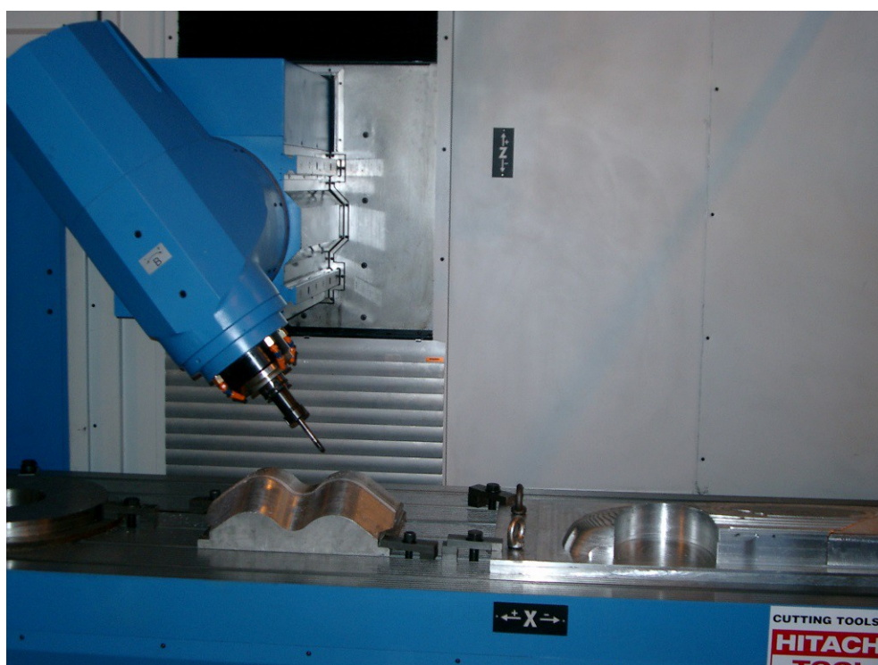
Immagine da catalogo della testa tiltante