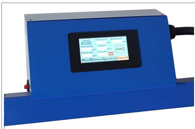
ZH-D SERIE 1