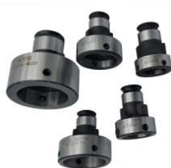
Bussole porta filiere