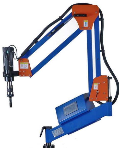
Testa di tipo orientabile Struttura in acciaio Ampio raggio di lavoro