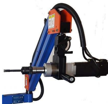
Testa di tipo orientabile Struttura in acciaio