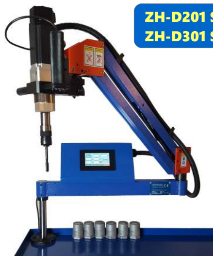
ZH-D201 SW ZH-D301 SW