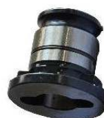
Adattatore per bussole 31/19