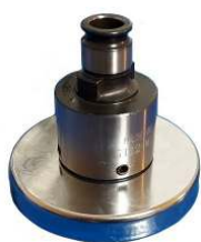
Piattello magnetico orientamento testa