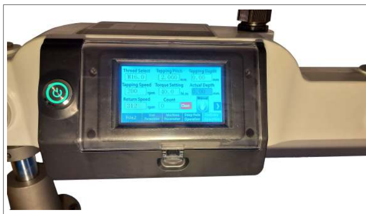
ZH-D SERIE 3

Le maschiatrici sono gestite da una unità di controllo con schermo touch screen installata sul braccio articolato e collegata ad un azionamento elettronico che a sua volta pilota il motore brushless dotato di encoder. L'unità è completamente programmabile dall'operatore e permette l'utilizzo della maschiatrica in modo manuale o automatico. Sono selezionabili un ciclo di maschiatura standard oppure un ciclo per maschiatura profonda rompitruciolo. Il sistema propone i valori preimpostati per filettature metriche ed in pollici. Sono comunque sempre impostabili dall'operatore i valori di: passo, coppia, profondità e numero di giri, per ottimizzare l'operazione in base al maschio utilizzato ed al tipo di materiale.