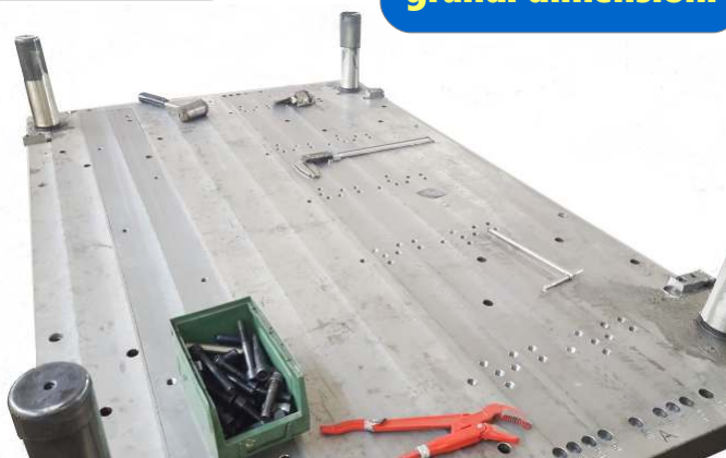
Modelli adatti per particolari di grandi dimensioni