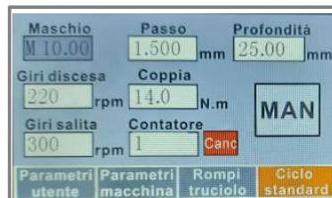
Tabelle utensili precompilate